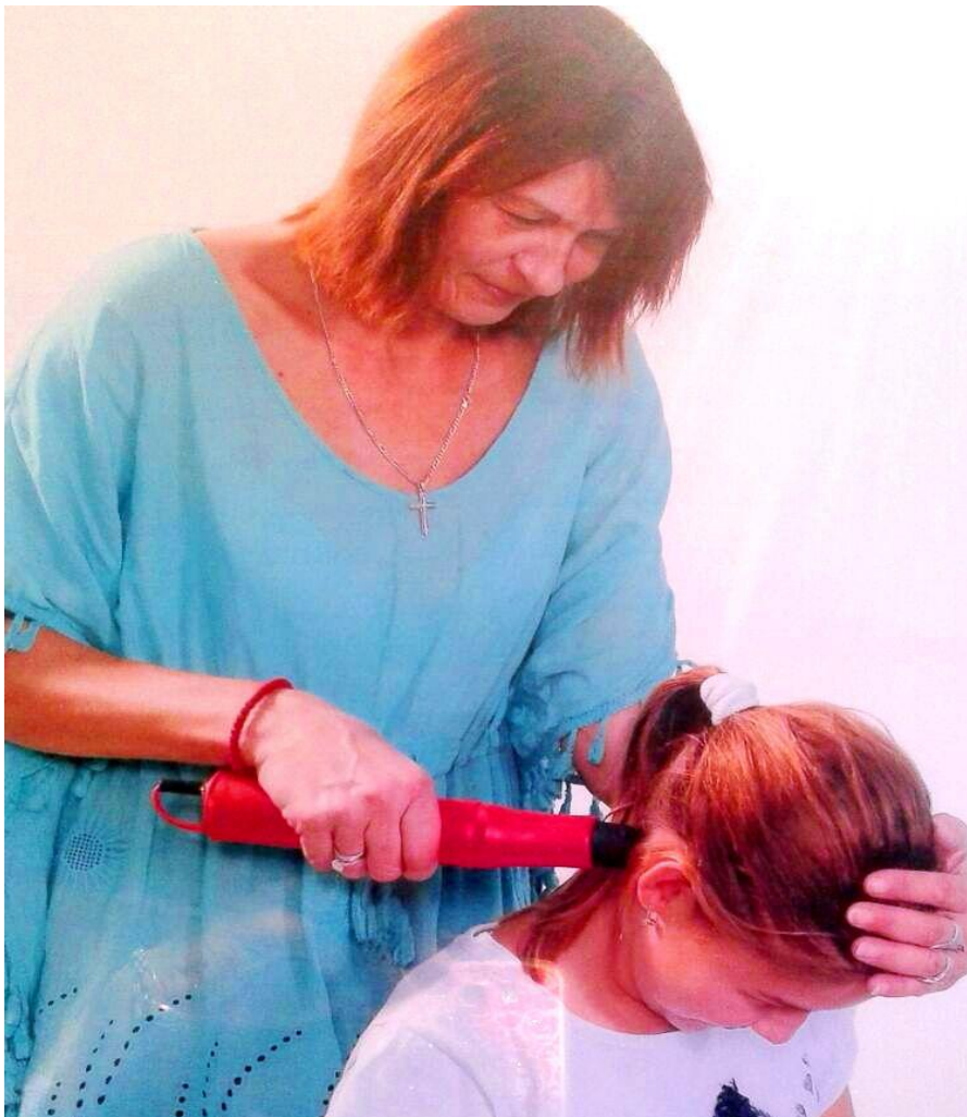
НАЈБОЉЕ ЈЕ КАД СЕ АТЛАС НАМЕНИ У ДЕТИЊСТВУ